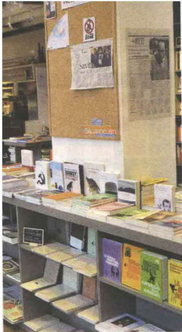
A sinistra, la Gogol&Company; sotto, la Design Library di via Savona