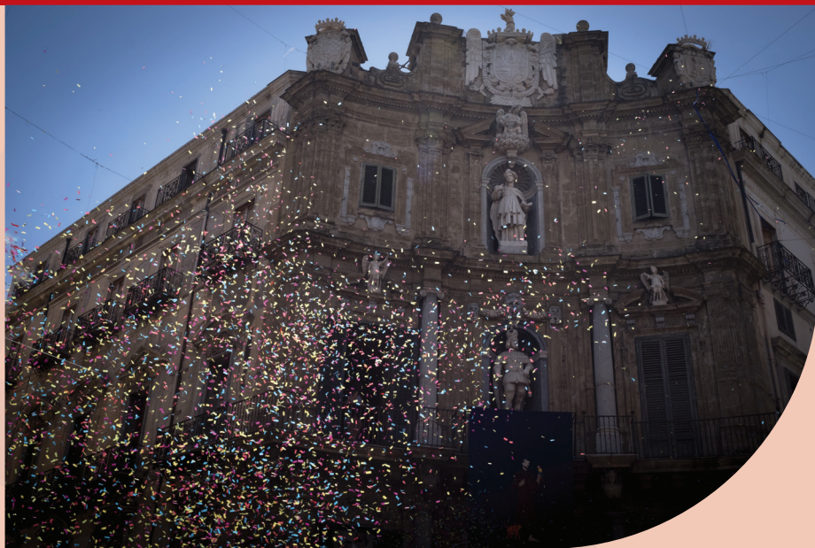
Manifesta 12 Palermo